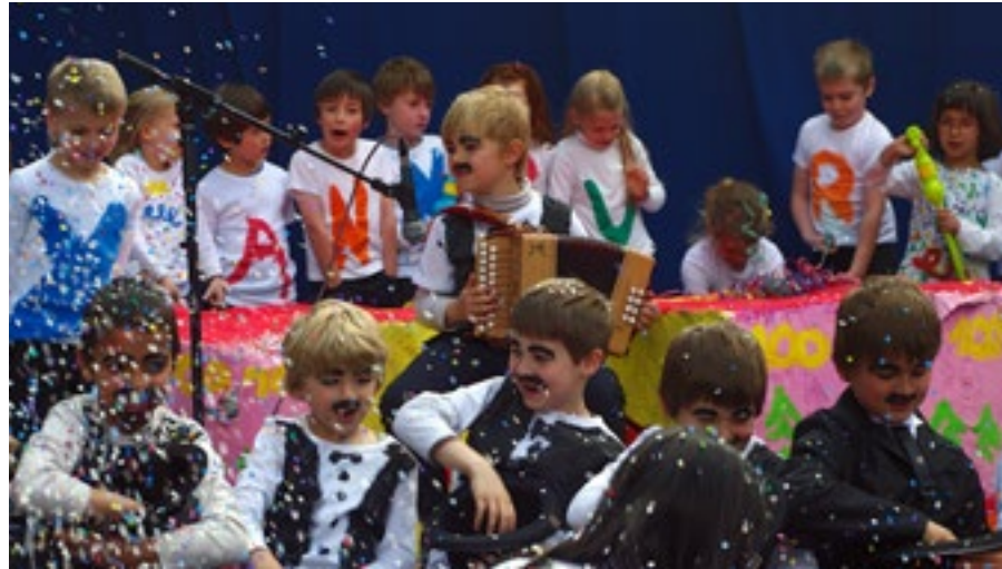
La Sapinière a fêté ses 100 ans / "La Sapinière" is 100 jaar oud